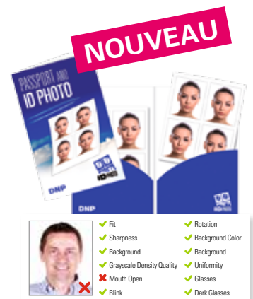
Fonction photo de passeport biométrique

Compact une fois fermé, emmenez-le partout !